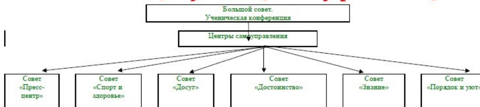
Схема ученического самоуправления школы № 27.